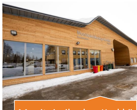
Monitoimikeskus Kerkkä 2022