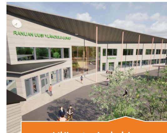
Yläaste ja lukio 2023 - 2024