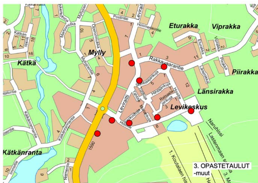
Opastaulujen sijoittuminen Levin ydinkeskustassa

Digitaalisissa tauluissa esitettävä materiaali vaihtuu määrävälein. Siinä voidaan esittää alueen opaskartan lisäksi tietoa alueen tapahtumista ja liittää siihen yritysten mainontaa.