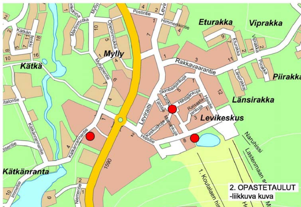
Vuorovaikutteisten opastaulujen sijoittaminen.

Lisäksi opastauluihin voidaan liittää erilaisia karttasovelluksia, joista voi hakea tietoa liikkeiden sijoittumisesta, rinteistä, aukioloajoista ym.