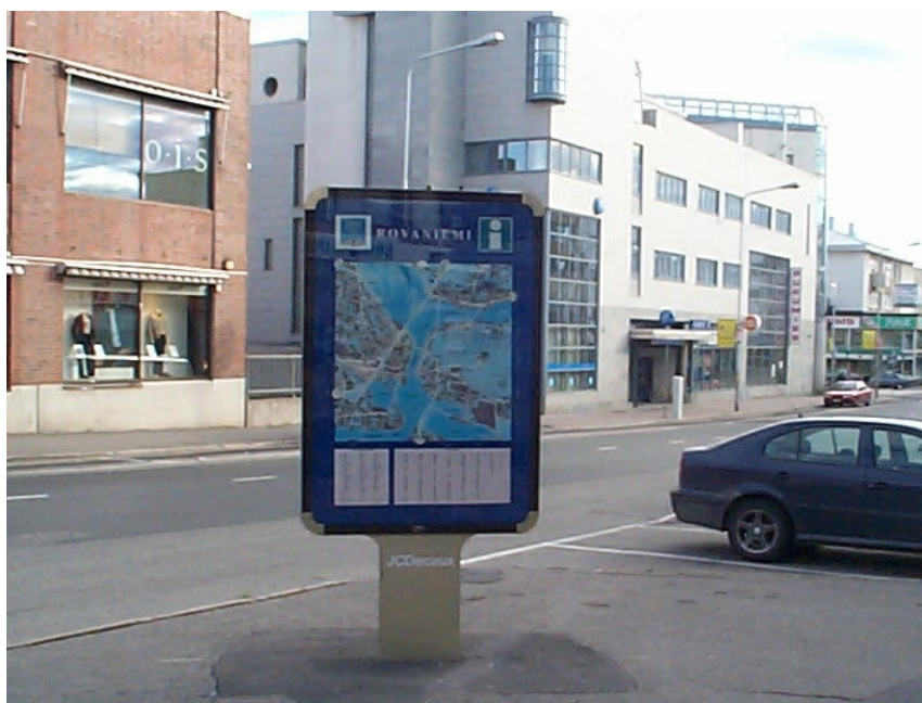
Esimerkki perinteisestä opastaulusta.