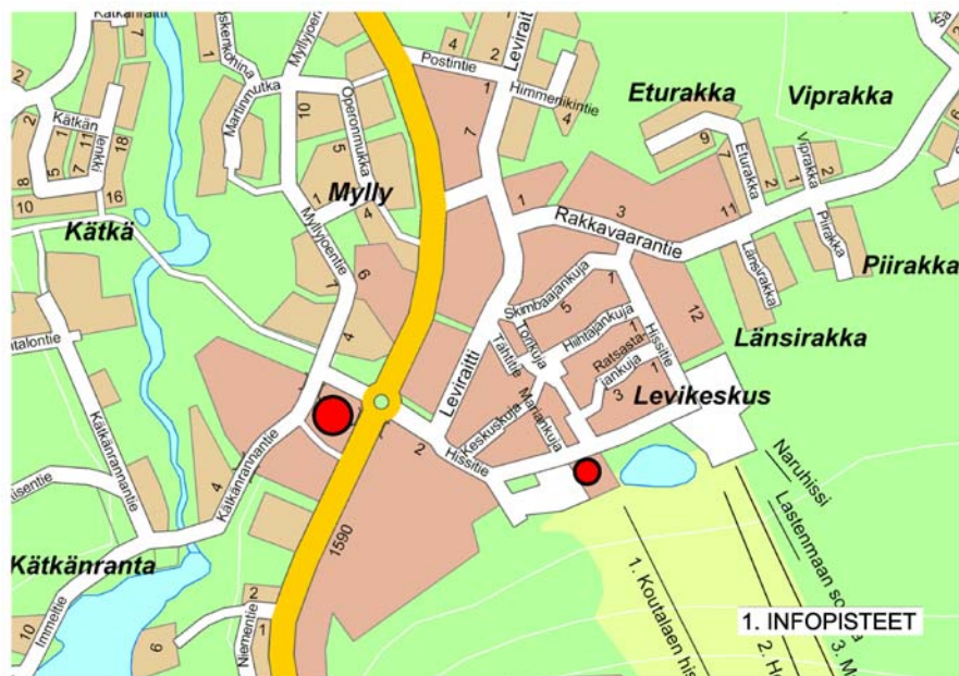
Infopisteet Levin ydinkeskustassa.

Toinen mahdollinen infopiste voidaan sijoittaa Levin Hissien Zero-Point -rakennukseen. Infopiste voi sijoittua esimerkiksi lipunmyynnin yhteyteen. Paikkaa Zero-Point -rakennuksen yhteydessä puoltaa sen keskeinen sijainti liikekeskustan ja rinteiden välitömässä läheisyydessä.