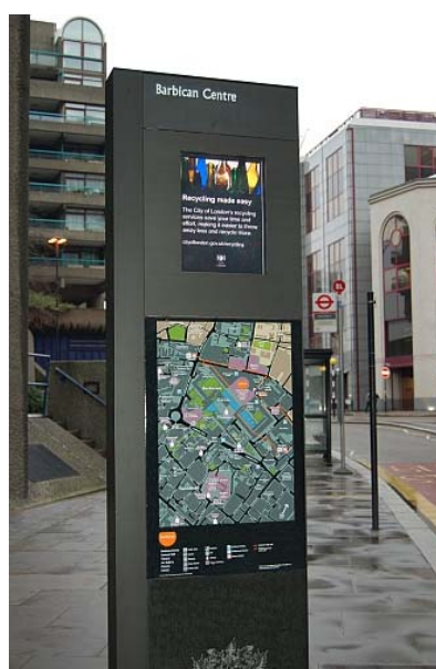
Esimerkkejä vuorovaikutteisista opastauluista